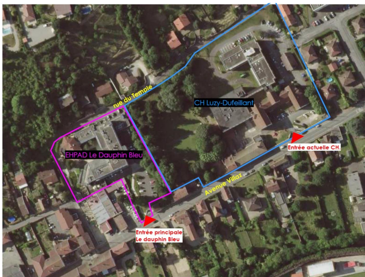
SITE DU CH INTERCOMMUNAL DE BEAUREPAIRE